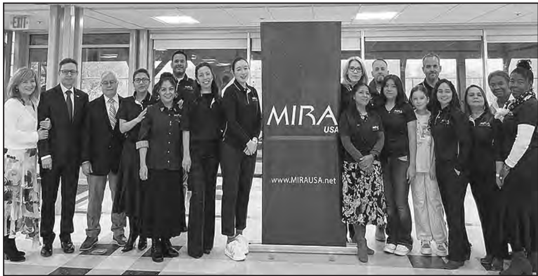
Grupo del personal de MIRA.

MIRA USA® es una organización 501 (c) (3) sin ánimo de lucro que promueve la integración social de los inmigrantes en EEUU.