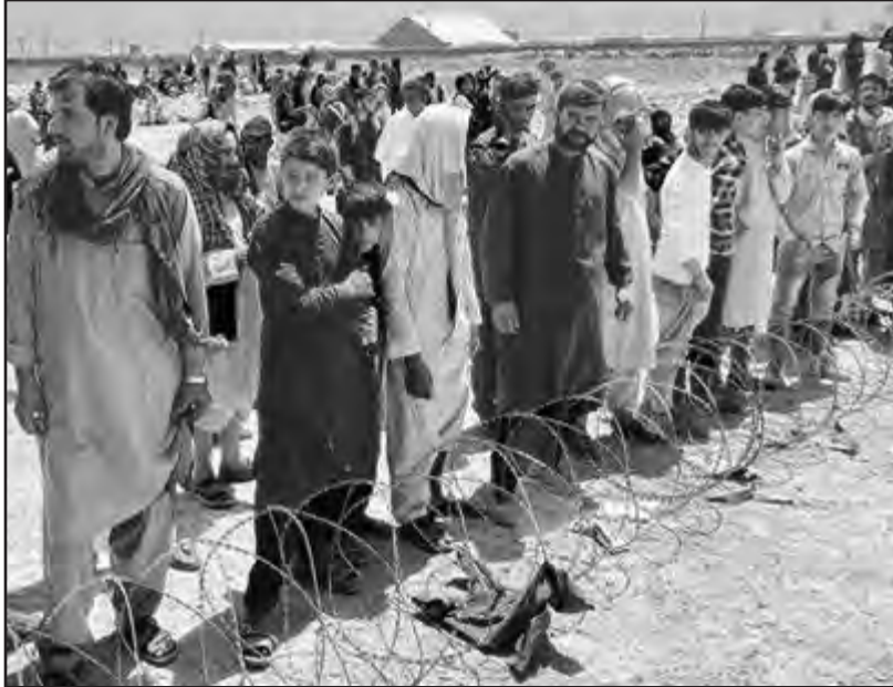
Refugiados en la frontera entre Pakistán y Afganistán en Spin Boldak, Afganistán

(SELV/HNW).- Cientos de soldados, policías y otros funcionarios del antiguo gobierno respaldado por Estados Unidos en Afganistán han sido sometidos a ejecuciones extrajudiciales, torturas, desapariciones o arrestos arbitrarios, desde que los talibanes tomaron el país, según las Naciones Unidas.