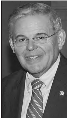
Sen. Bob Menéndez

WASHINGTON – El Senador Bob Menéndez (D-N.J.), Presidente del Comité de Relaciones Exteriores del Senado, anunció que presentará una propuesta legislativa para expandir el efecto de la ley VERDAD después de este receso de agosto en el Congreso. Esta legislación integral, que es una amplia actualización legislativa de la ley VERDAD del 2019, tiene como objetivo garantizar que avancen las negociaciones para restaurar la democracia en Venezuela, abordar la compleja crisis humanitaria del país y asegurar que el régimen de Maduro y sus secuaces rindan cuentas por sus graves violaciones de los derechos humanos y actividades criminales. “Mientras los ciudadanos y líderes democráticos de Venezuela buscan un futuro definido por dignidad, justicia y sobre todo libertad, Maduro está tomando medidas adicionales para consolidar su dictadura criminal. En vez de facilitar las condiciones para elecciones democráticas, el régimen de Maduro disolvió el Consejo Nacional Electoral de Venezuela, impidió que la principal candidata de la oposición, María Corina Machado, se postulara para el cargo y bloqueó la entrada al país de observadores electorales internacionales”, declaró el Senador Menéndez. “Aunque los Estados