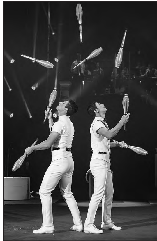
LOS HERMANOS REYES, DE CHILE

Ahora, en su 54° año entreteniéndolo a generaciones de familias con producciones de calidad inolvidable, el nuevo espectáculo de Circus Vázquez 2023, presentado íntegramente en inglés, seguramente continuará esa tradición. Esta experiencia de circo en vivo impresionante, desafiante a la muerte, hilarante y ase-