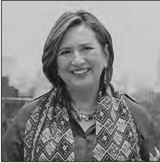
Senadora Xóchitl Gálvez

En una actitud de aparente inconformidad, Paredes no asistió el miércoles en la tarde